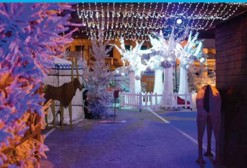
← La Madeleine → Le village «Hiver blanc», vue d'ensemble. Décembre 2012 ↓

Avec énergie et créativité, les artistes de la Cie L'éléphant dans le boa travailleront à faire de vos voeux de spectacles... une réalité.